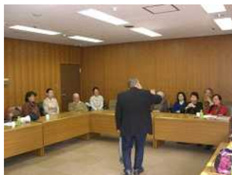
ブロック長のマジック