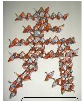
寿 80 羽

今、私は先生のアイデアによる斬新な創作連鶴にもチャレンジして生かされている命に感謝しながら折り続けています。