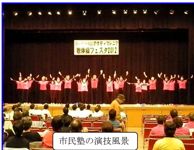
市民塾の演技風景