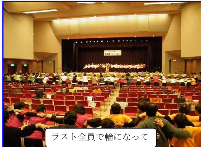
ラスト全員で輪になって