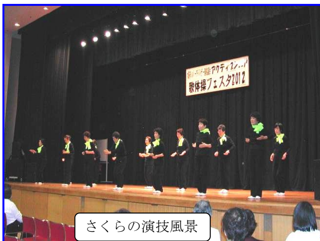
さくらの演技風景