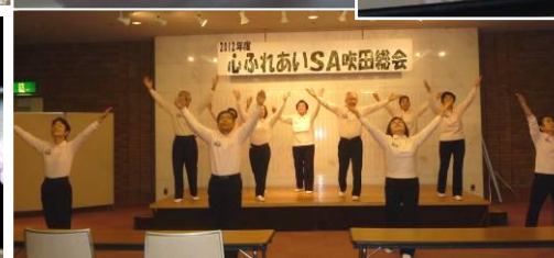
総会及び部会発表会で集めた スナップ写真