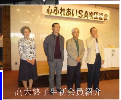
高大終了生新会員紹介