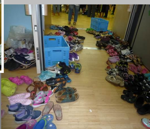
下足箱に入らない履き物