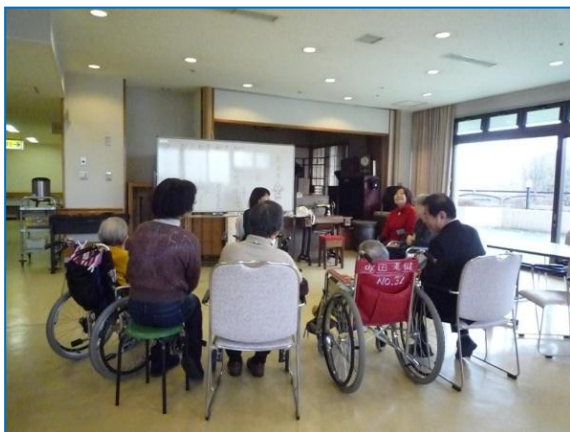
老健での回想法の 1 場面

のものを触って当てる、新聞紙を巻いた棒で遊び、最後はブルーシートを全員で波のように動かしながら歌を唄いました。レクリエーションの間お互いの会話で私達は相手が認知症の方だとの感覚は無く全く普通に接していました。私達が駐車場に降りた時 3 階から皆さん両手を振ってくれました。