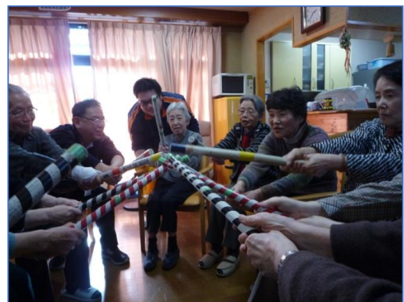
施設でのレクリエーション交流