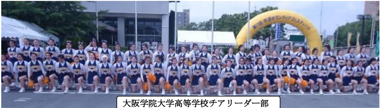
大阪学院大学高等学校チアリーダー部

ープが参加して天候にも恵まれ盛大なフェスティバルとなりました。大阪学院大学高校のチアリーダー部のはつらつとした演技は観客を魅了しました。