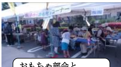
おもちゃ部会と SAおもちゃ市民塾