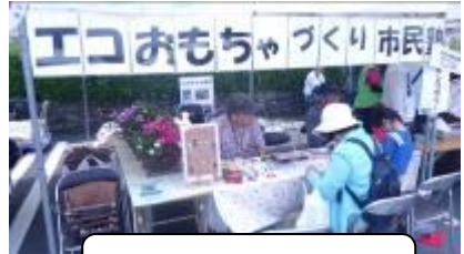
エコおもちゃ市民塾