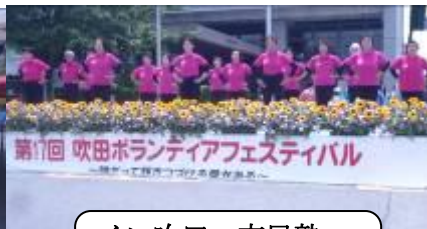
イン吹田・市民塾 合同グループ