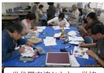
世代間交流おもちゃ学校