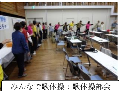
みんなで歌体操:歌体操部会