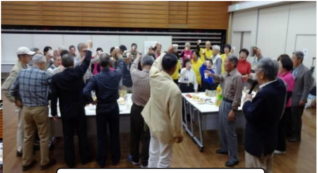
最後に乾杯:ご苦労様でした