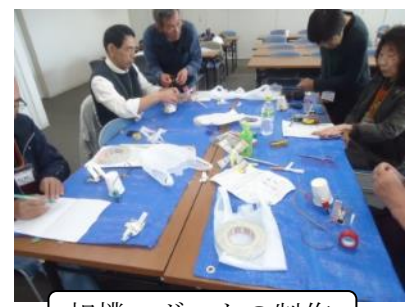
相撲ロボットの制作