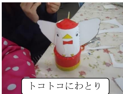
トコトコにわとり