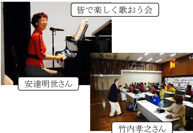
皆で楽しく歌おう会