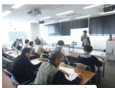
入校生の自己紹介