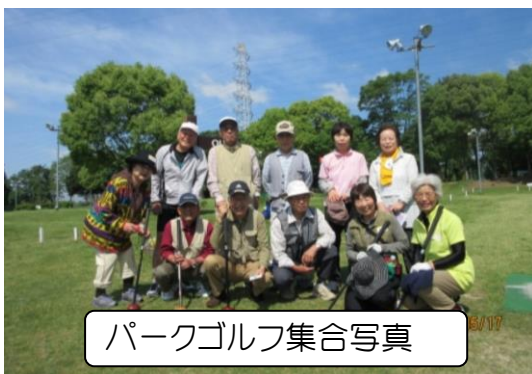
パークゴルフ集合写真