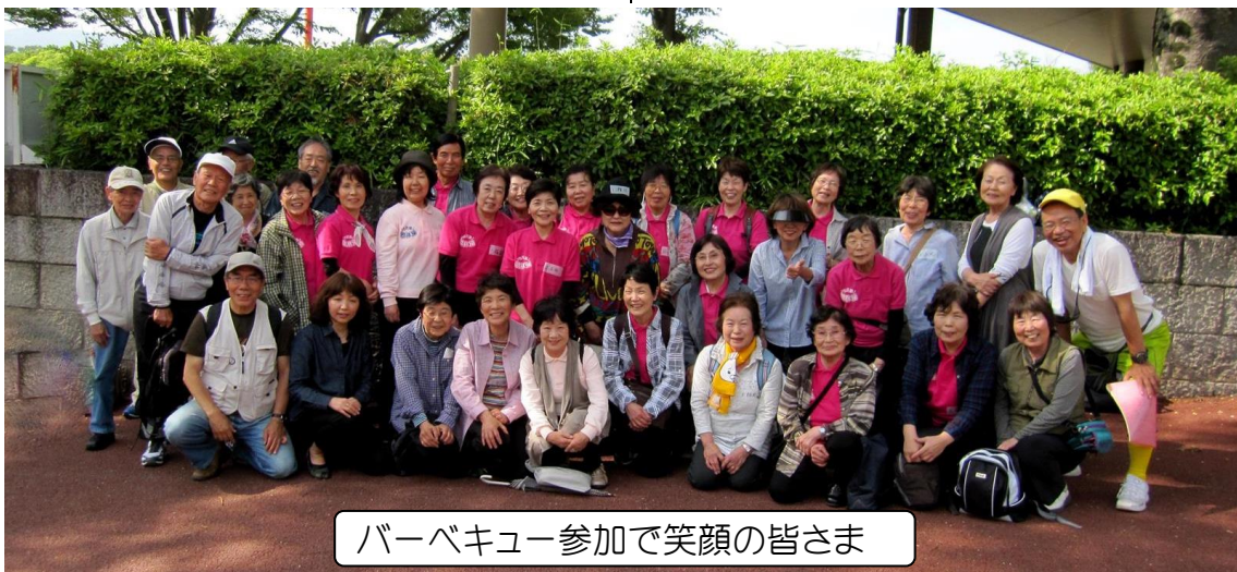
バーベキュー参加で笑顔の皆さま