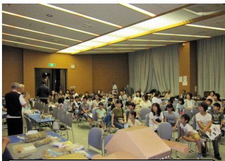
7月26日 手づくりおもちゃ