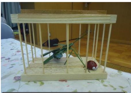
7月21日 昆虫を作ろう!!

た。下記の写真に示すように 6 日間にわたり人気の工作教室を行い、好評をはくしました。SA 吹田の講座はあまりにも好評で、申し込みが多すぎて、博物館からうれしい苦情?が来ています。申し込みが多すぎるとその事務処理で博物館の学芸員の手が取られ、本来の仕事が出来ないので来年からどうするか再検討するそうです。評判の良すぎるのもよし悪しのです。(笑)