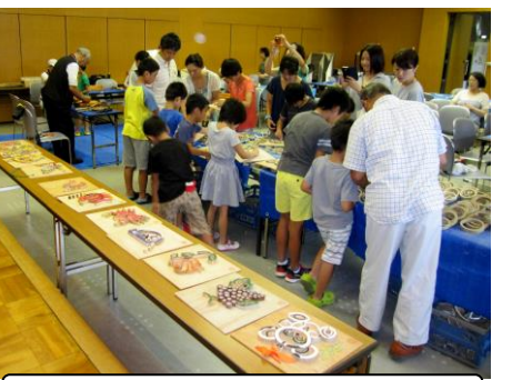
8月11日 竹で立体お絵かき