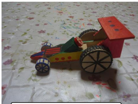
8月4日 レーシングカー