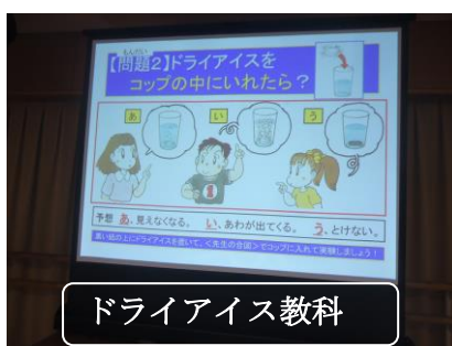
ドライアイス教科