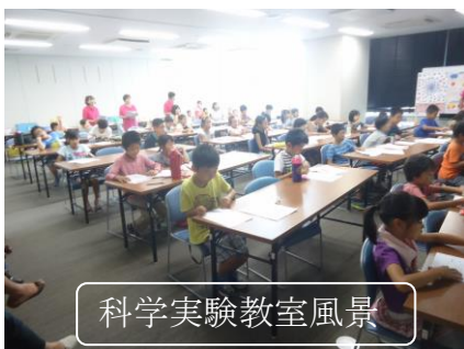
科学実験教室風景