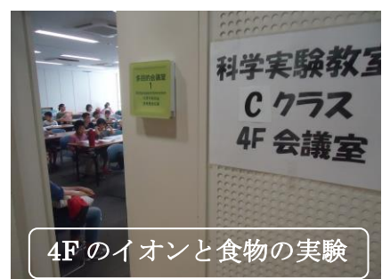
4F のイオンと食物の実験