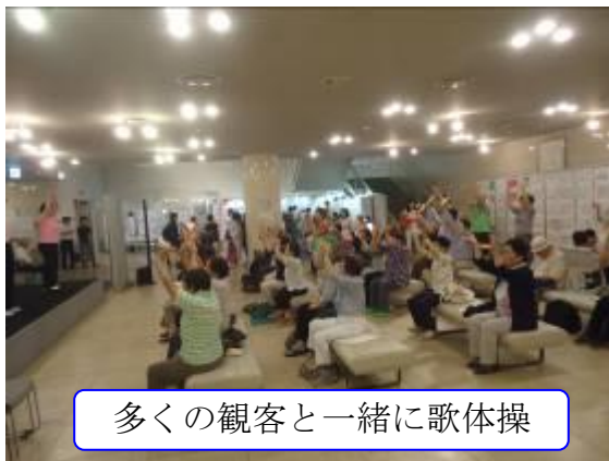
多くの観客と一緒に歌体操