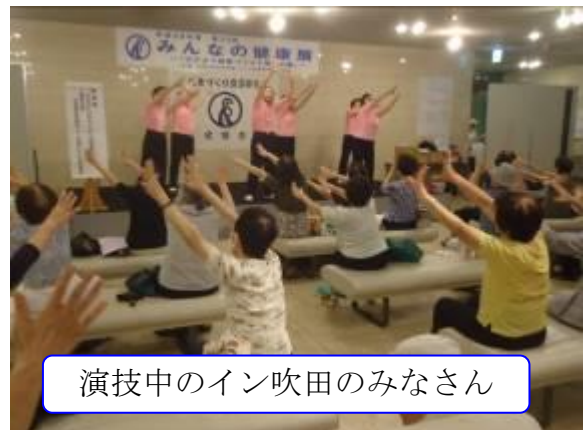
演技中のイン吹田のみなさん