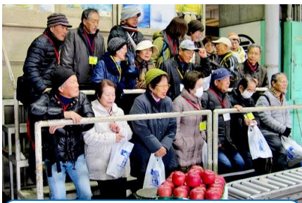
青果セリ場所で説明を聞く

加工約60・野菜約70)へ。これらの店舗では参加者が小売業者らの立場になって仕入れ体験(購入)することができた。11時15分業務管理棟で市場の一日の様子などを解説した広報ビデオを視聴、11時30分見学会は無事終了。食を支えるプロの熱気を感じた楽しい時間であった。