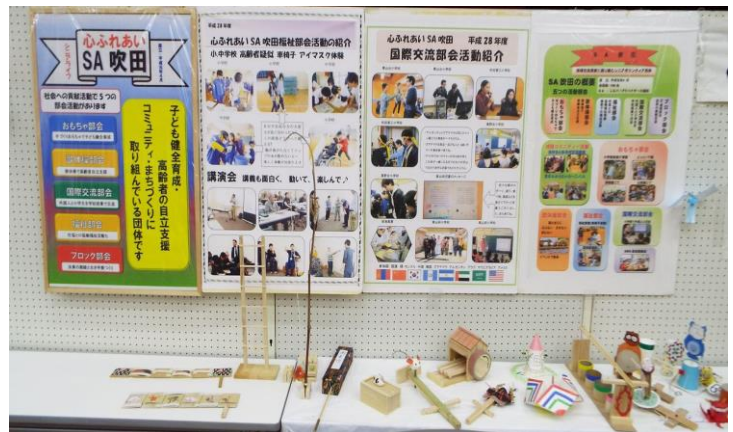
パネル紹介・おもちゃ展示