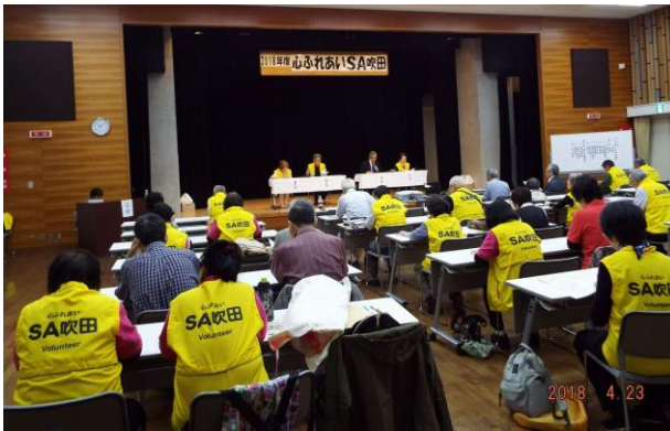
総会が厳かに肅々と進行