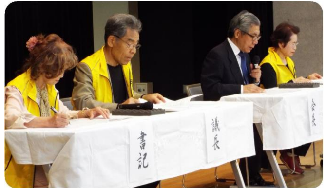
今井会長ほか壇上のお歴々