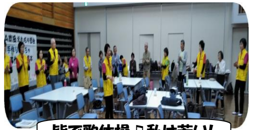
皆で歌体操♪私は若い!