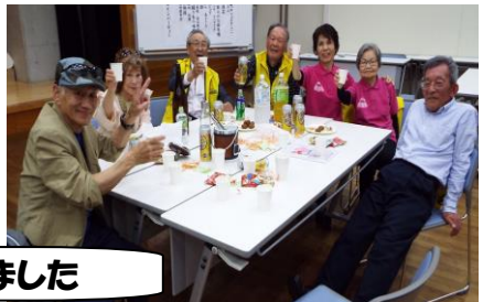
各テーブルとも大いに盛り上がっていました