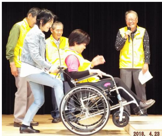
福祉部会車いす実演