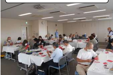
おもちゃ学校 授業風景