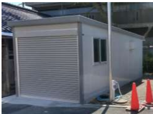
エスエーハウス・外観