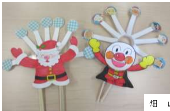
畑 貞造 記