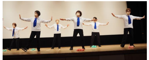
高大同好会 なでしこ