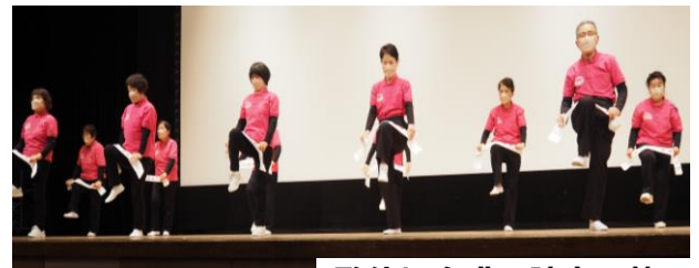
歌体操介護予防市民塾