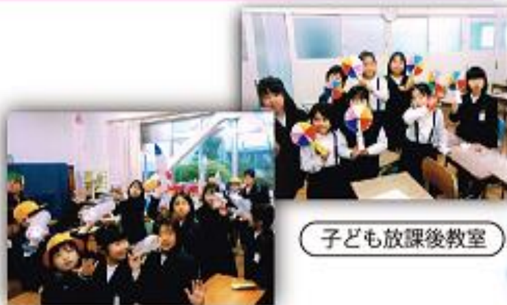
子ども放課後教室