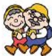
植樹ボランティア