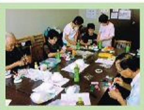
おもちゃ指導者研修